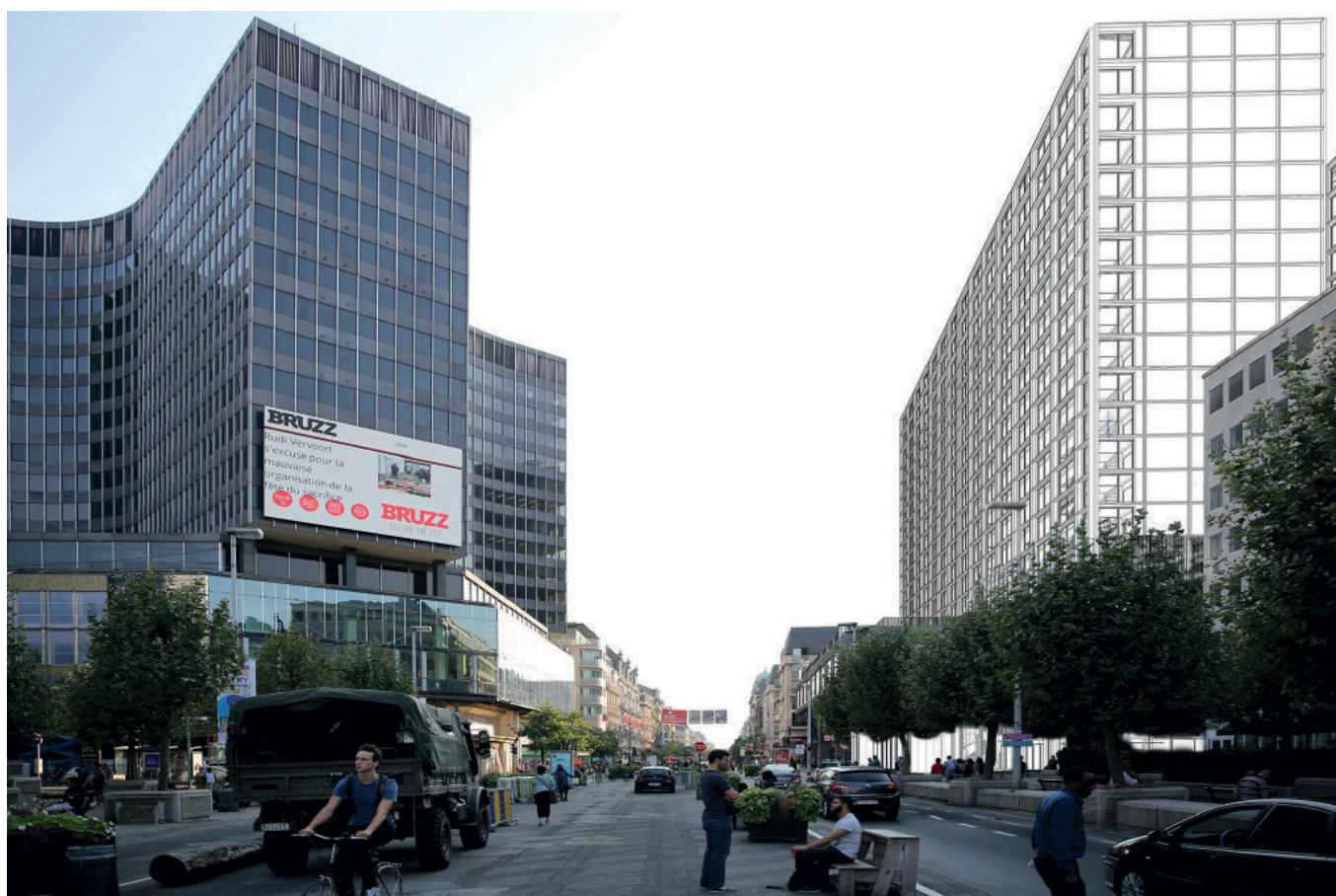
Réaffectation de la tour Philips, place de Brouckère, Bruxelles, Conix RDBM