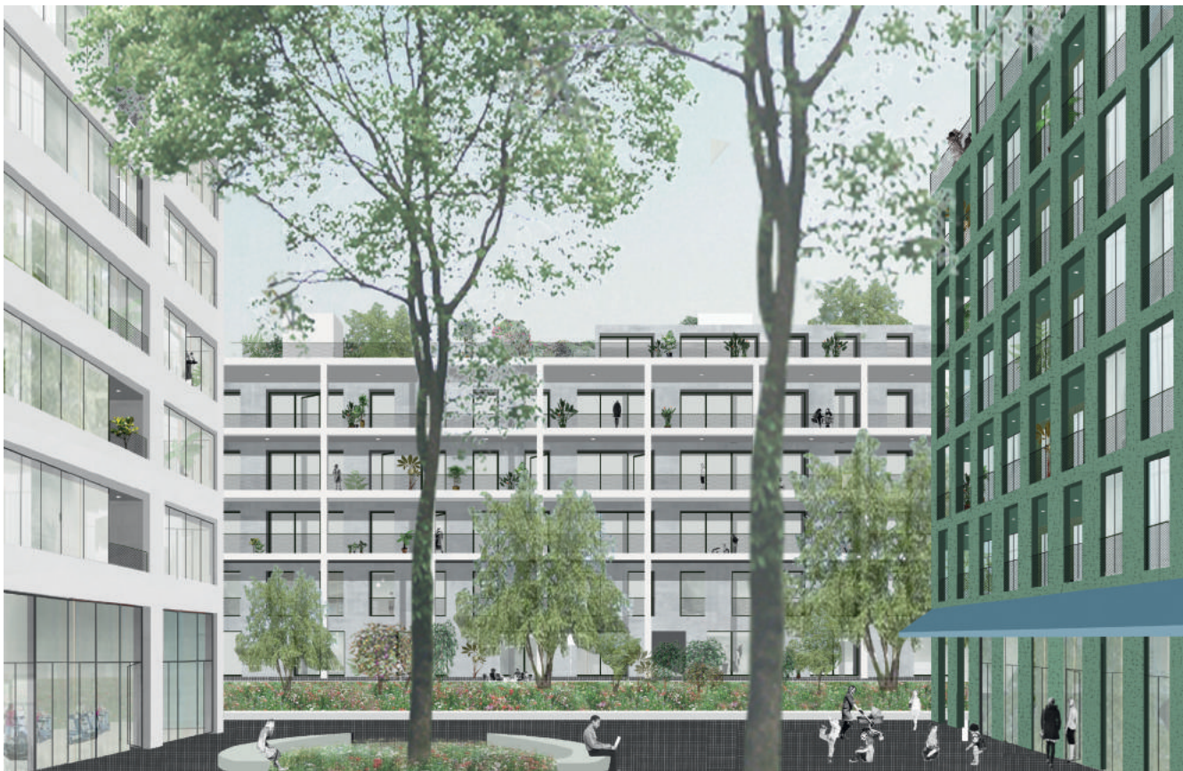
KBC, Havenlaan, Bruxelles, Triple Living, OFFICE Kersten Geers David Van Severen en collaboration avec NFA