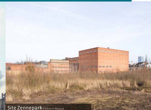
Site Zennepark