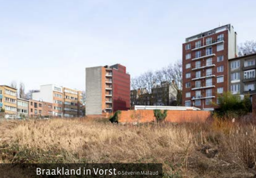
Braakland in Vorst © Séverin Malaud