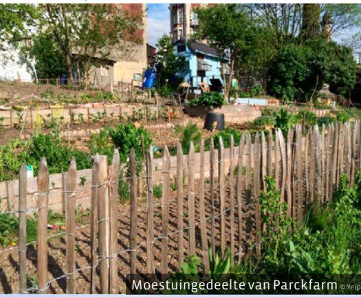
Moestuingedeelte van Parckfarm