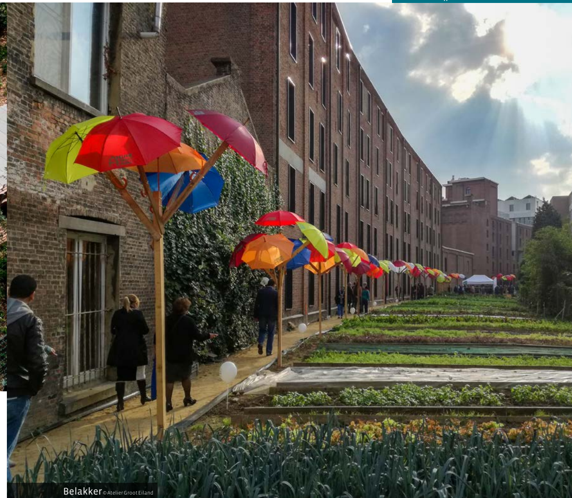
Belakker © Atelier Groot Eiland