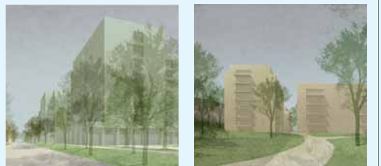
Zone M Thurn en Taxis. Winnend project © awg | SBa | noA

betere communicatie rond geslaagde projecten die het goede voorbeeld geven en kunnen inspireren."