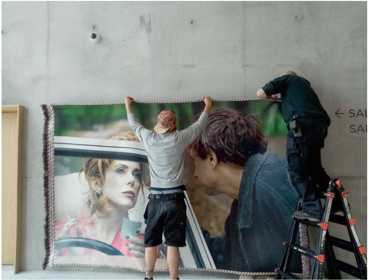
↓↑ Centre culturel « Pont des Arts » à Marcq-en-Barœul, 2021. Architectes: HBAAT et Vplus. Collaboratrice: Flore Fockedey.