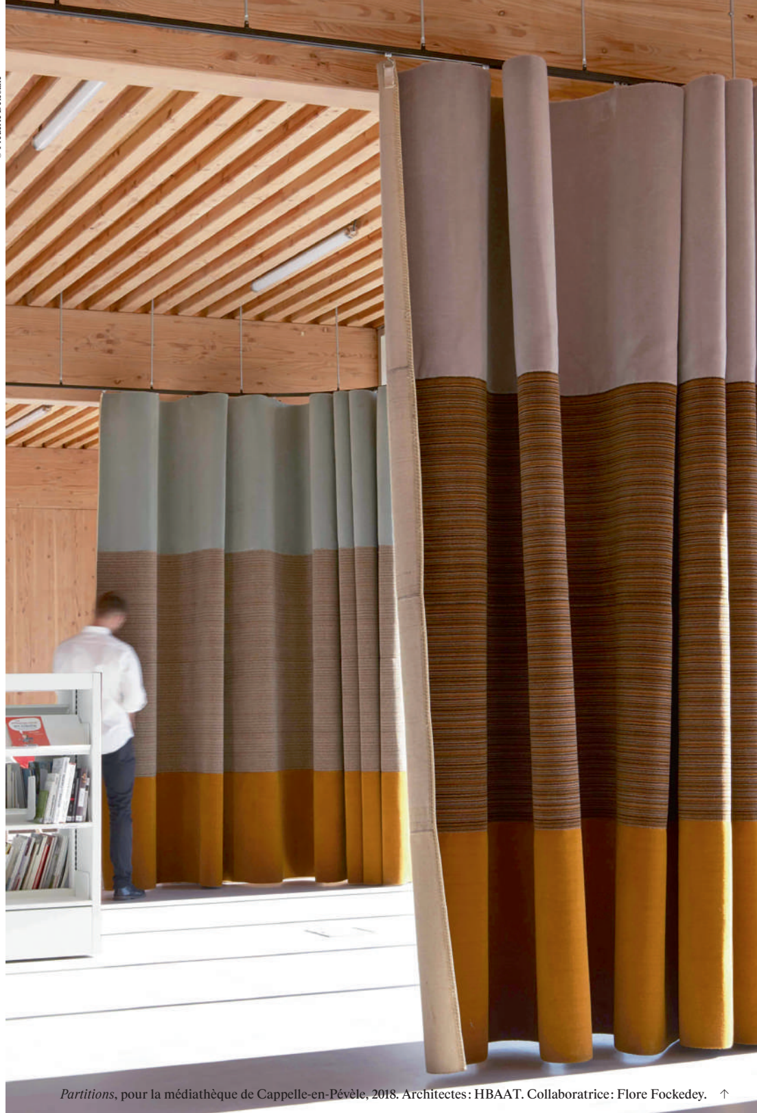
Partitions , pour la médiathèque de Cappelle-en-Pévèle, 2018. Architectes : HBAAT. Collaboratrice : Flore Fockedey. ↑