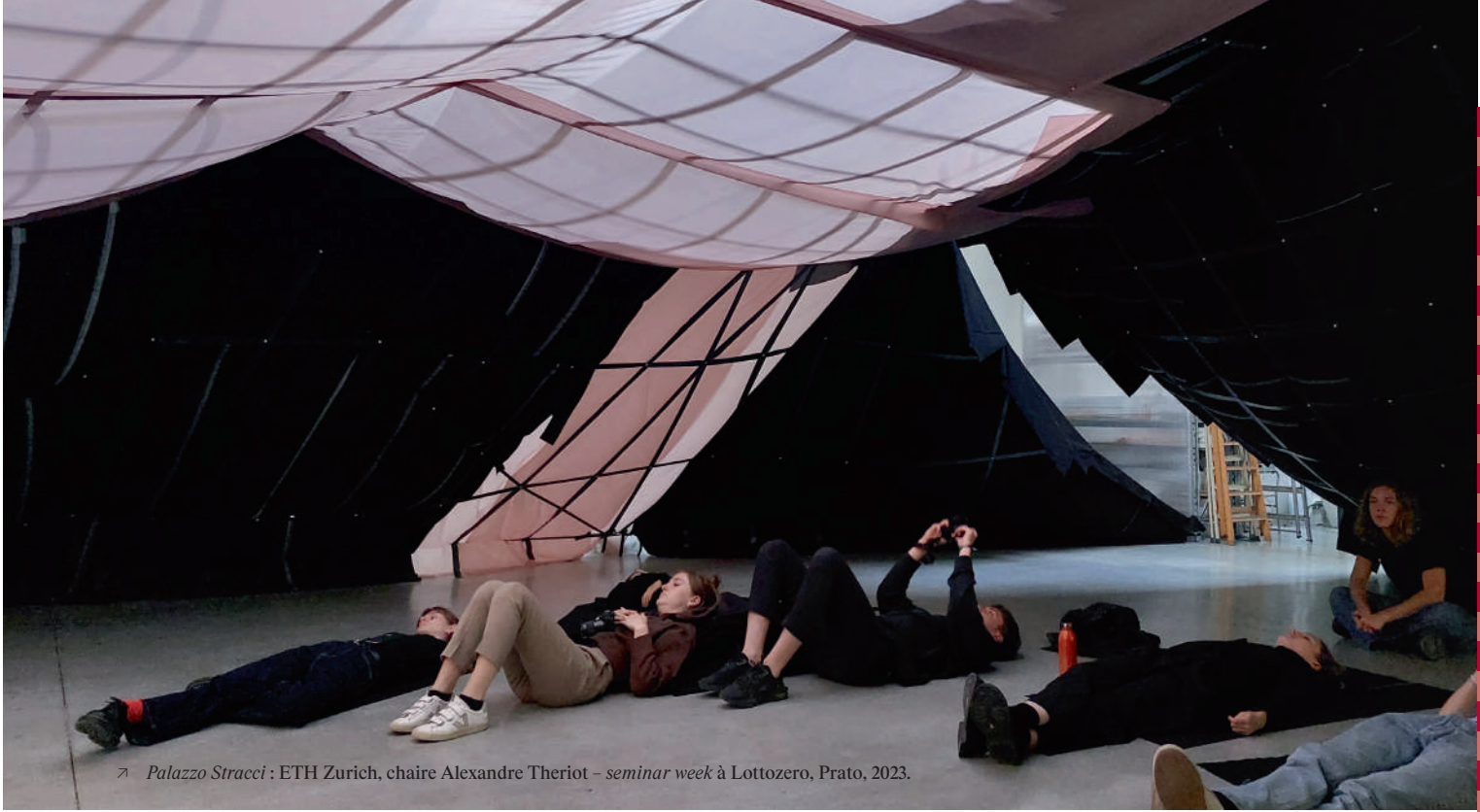
➤ Palazzo Stracci : ETH Zurich, chaire Alexandre Theriot – seminar week à Lottozero, Prato, 2023.