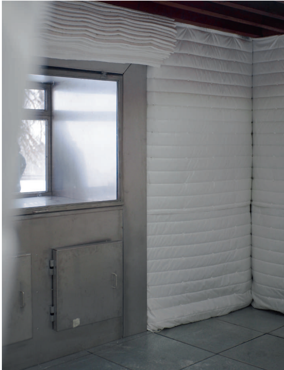
➤ Blanc-manteau, projet « Mémoires du futur » du collectif ZERM, 2023, dans le cadre des Mondes nouveaux, initiés par le ministère de la Culture, France. Collaborateur: Antonin Bachet.