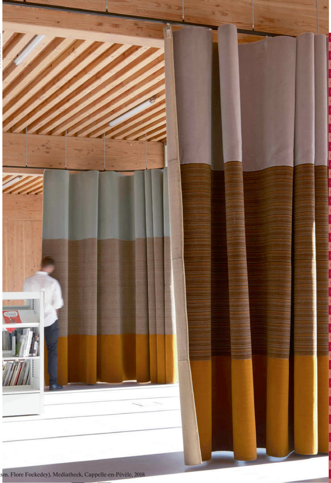
➤ HBAAT - Chevalier-Masson (ism. Flore Fockede), Mediatheek, Cappelle-en-Pévèle, 2018