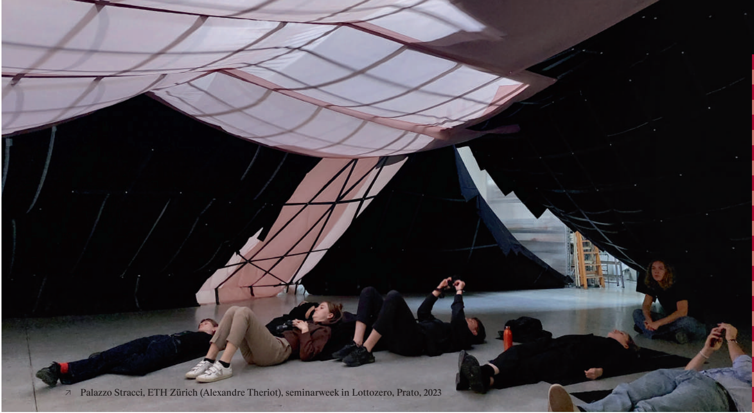
➤ Palazzo Stracci, ETH Zürich (Alexandre Theriot), seminarweek in Lottozero, Prato, 2023