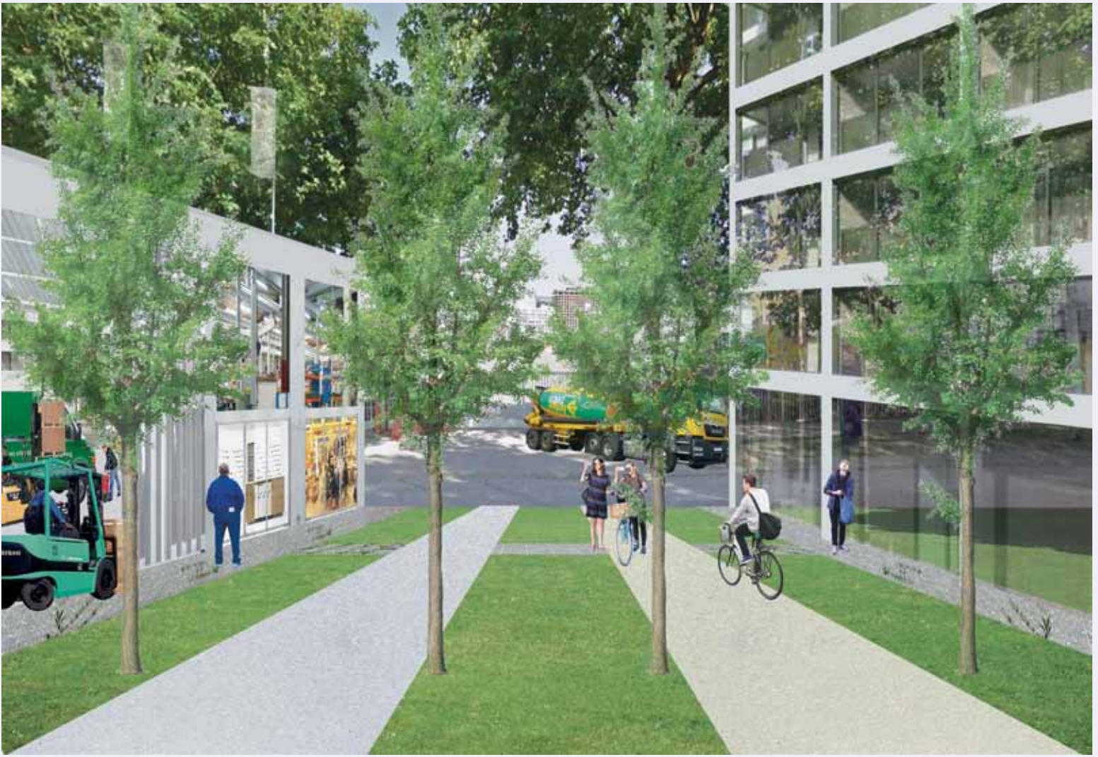
Keep Your Distance Micro-zoning Zone D Tact – Inter-Beton © Equipe Canal