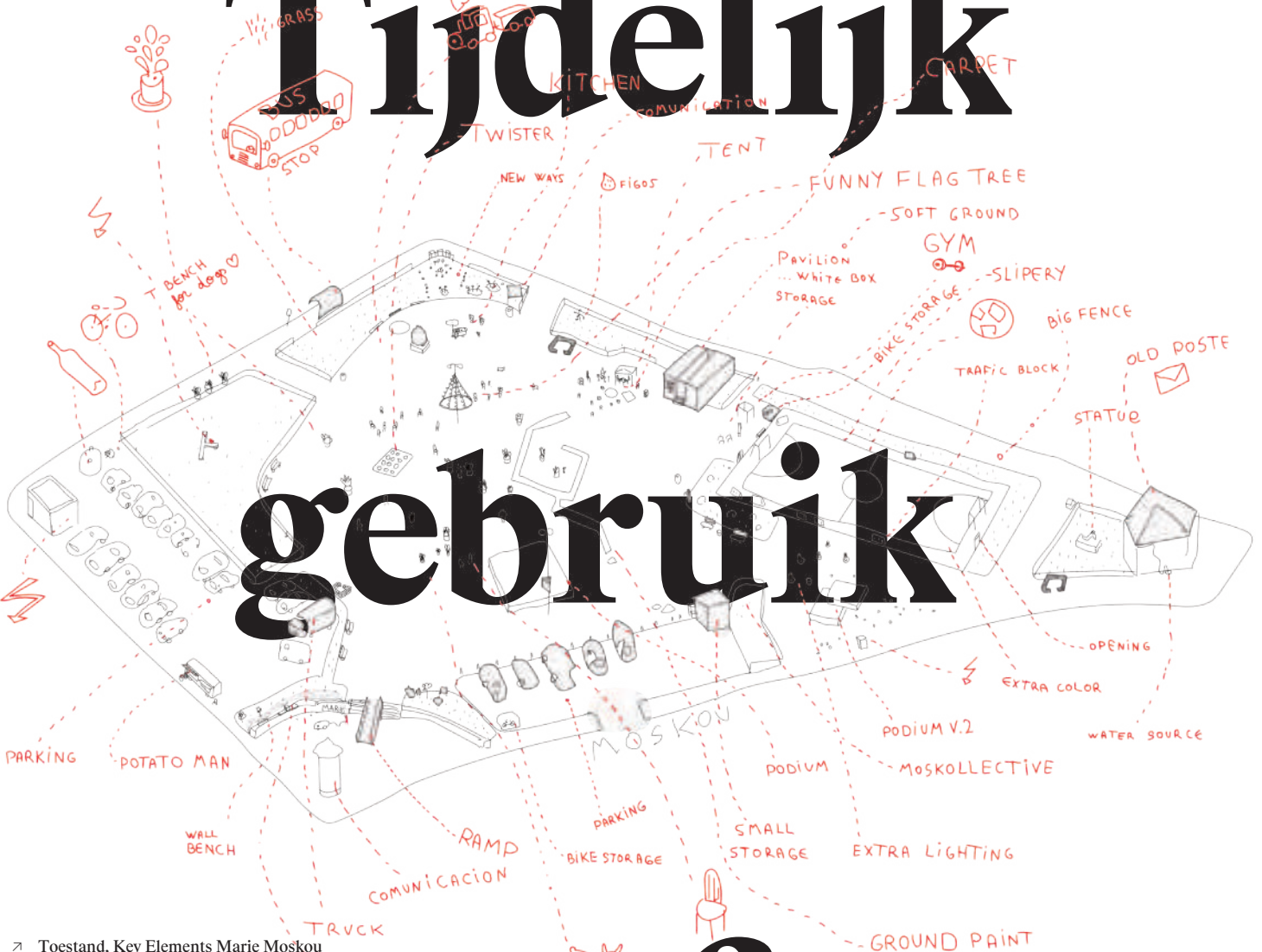
➤ Toestand, Key Elements Marie Moskou