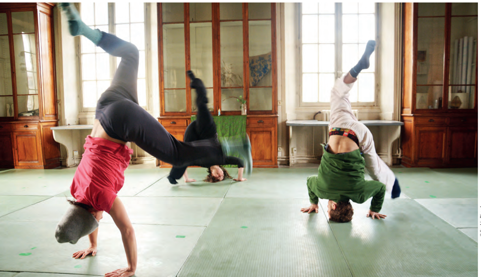
↓ Open groepsdanslessen in de voormalige bibliotheek van de faculteit wetenschappen Pasteur.