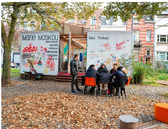
Tijdelijk gebruik op het Marie Jansonplein