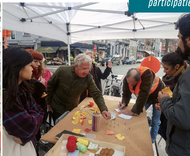
Het participatieproces voor het Kasteleinsplein in Elsene ©ARTER Architects

moesten worden in het toekomstige herontwikkelingsproject van het plein. Deze Key Elements werden niet alleen aan de geselecteerde ontwerpteams meegegeven voor de opmaak van hun ontwerpvoorstel, maar ook gepresenteerd aan het publiek (verenigingen, gebruikers, enz.). In de wedstrijdjury kreeg bovendien ook een vertegenwoordiger van het collectief Toestand een plaats.