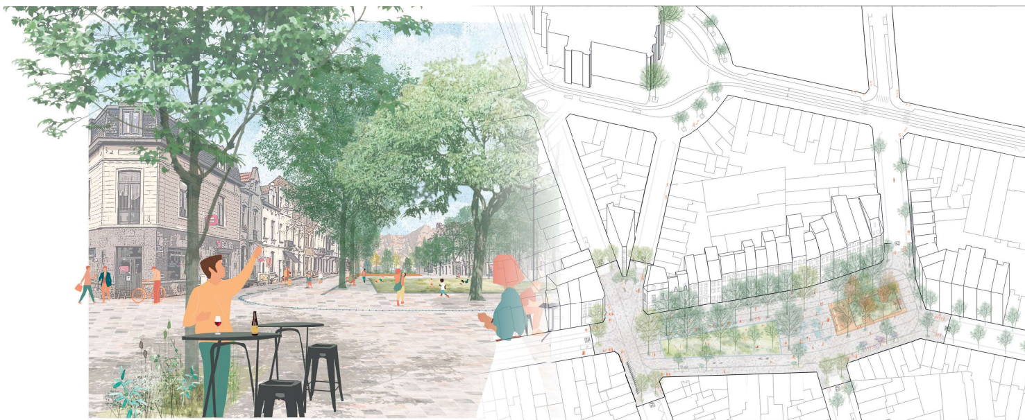
Heraanleg van het Kasteleinsplein door het team Taktyk – Alive Architecture – Res Derelictae – Antea Group ©Taktyk-Alive Architecture-Res Derelictae-Antea Group