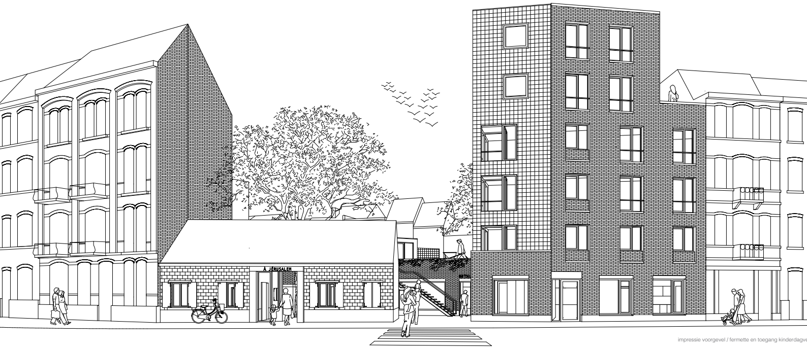
Impressie voorgevel / fermenite en toegang kinderdagvo...