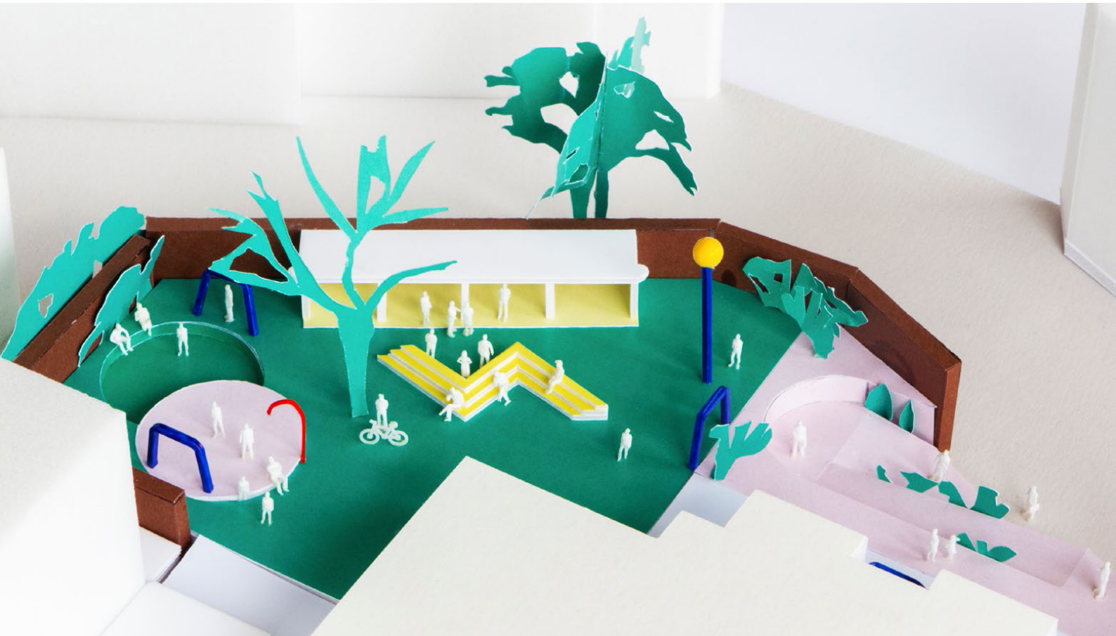
1. DE HELLING